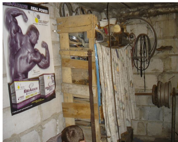
Zdjęcie: Pomieszczenia gospodarskie wykorzystane na potrzeby stworzenia siłowni przez lokalną młodzież