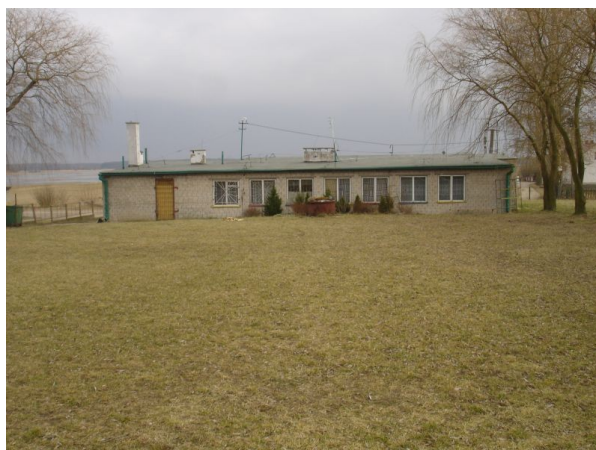
Zdjęcie: Budynek Wiejskiego Domu Kultury w Łapach-Szolałdach