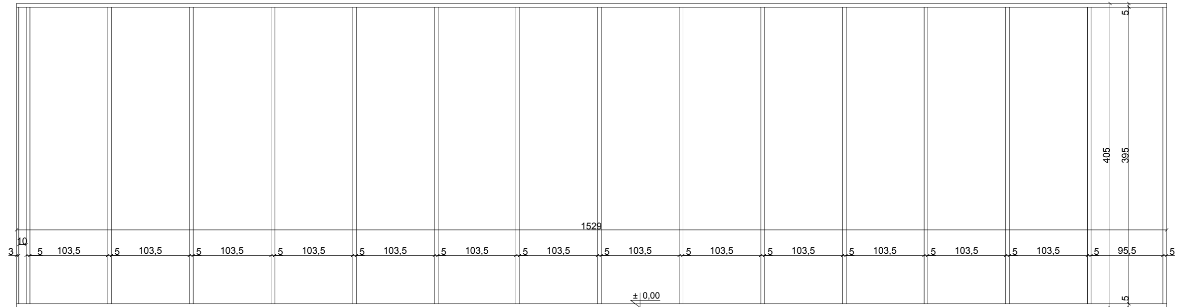
PODZIAŁ FASADY POŁUDNIOWEJ